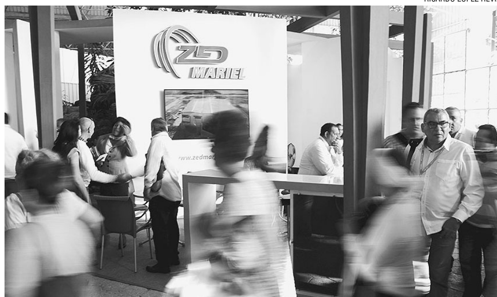
RICARDO LÓPEZ HEVIA

«No total esta pasta conta de 456 projetos, por um montante de capital ascendente a US$ 10,7 bilhões (10.700.000.000). Os projetos encontram-se distribuídos por todo o país e se corresponde com as bases do Plano Nacional de Desenvolvimento até 2030», assegurou Malmierca Diaz.