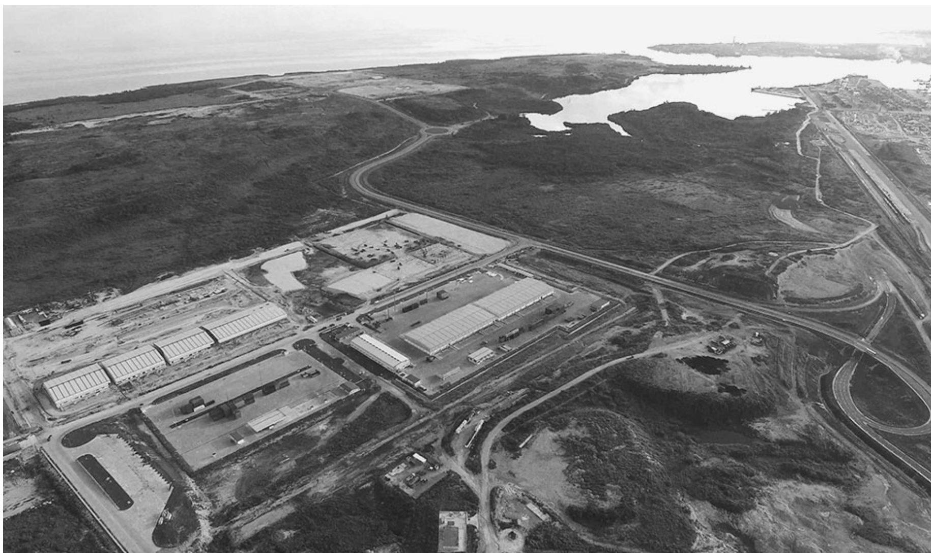
Zona Especial de Desarrollo Mariel: (ZEDM) uma das maiores atrações para o capital de fora.